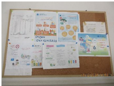
ภาพที่ 2-3 บอร์ดประชาสัมพันธ์ของโครงการ