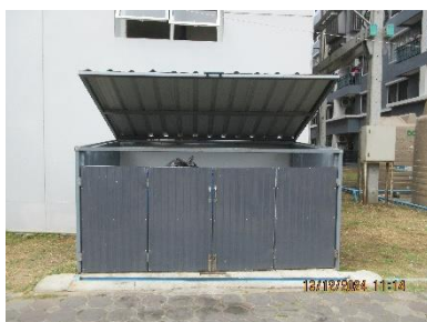
ภาพที่ 2-6 ถังขยะรวมของโครงการ