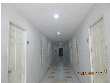
ภาพที่ 2-8 หลอดไฟ LED