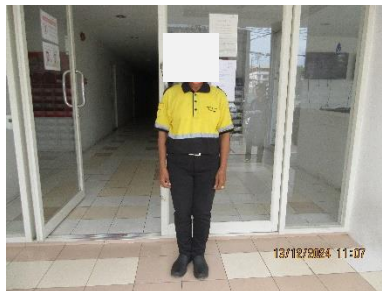
ภาพที่ 2-12 เจ้าหน้าที่รักษาความปลอดภัยของโครงการ