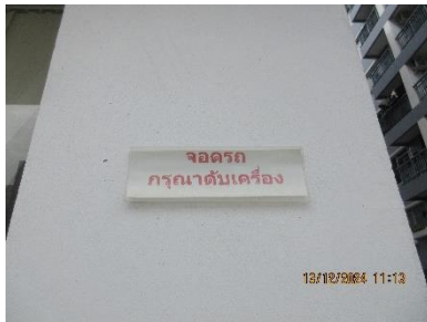
ภาพที่ 2-1 ป้ายห้ามติดเครื่องยนต์