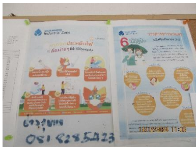
ภาพที่ 2-5 ป้ายรณรงค์ประหยัดน้ำ-ไฟ