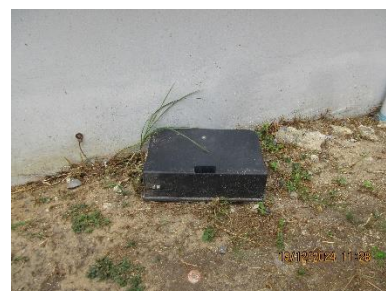
ภาพที่ 2-17 กล่องดับหนู