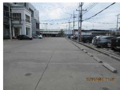
ภาพที่ 2-13 พื้นที่จอดรถโครงการ