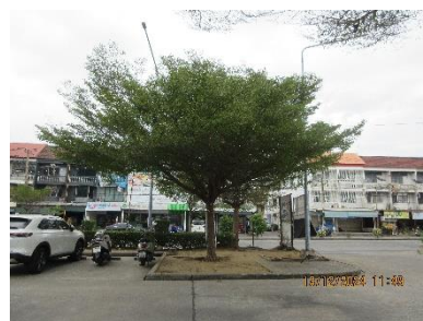
ภาพที่ 2-15 พื้นที่สีเขียวของโครงการ