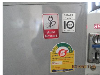
ภาพที่ 2-7 เครื่องใช้ไฟฟ้าเบอร์ 5