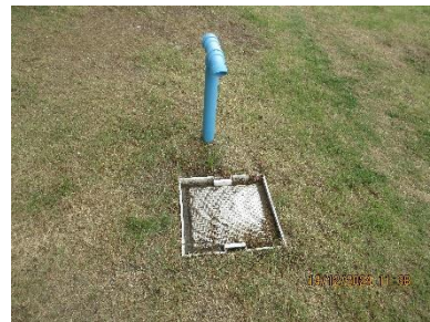
ภาพที่ 2-4 ระบบบำบัดน้ำเสียโครงการ