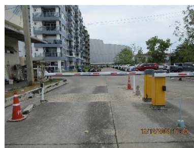
ภาพที่ 2-14 เครื่องกั้นรถเข้า-ออก โครงการ