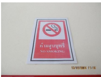
ภาพที่ 2-16 ป้ายห้ามสูบบุหรี่