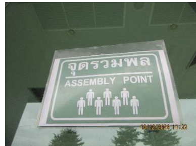
ภาพที่ 2-11 จุดรวมพล