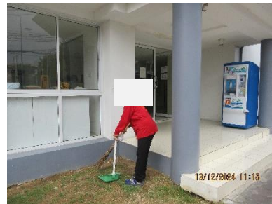
ภาพที่ 2-2 แม่บ้านทำความสะอาด